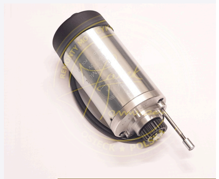
01 DYNAMO DL 7