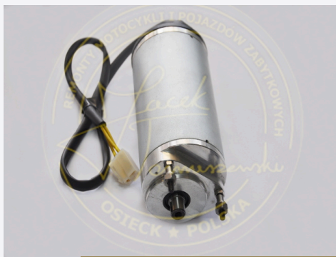
01 DYNAMO DL 6