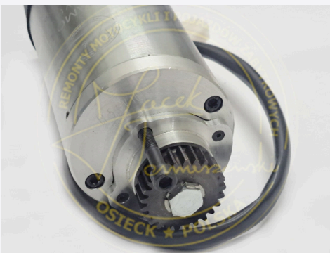
01 DYNAMO DL 5